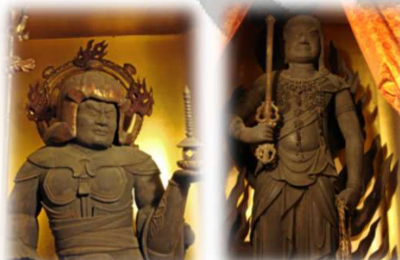
牛玉所殿の秘仏（祈祷所）

今は厄除けの神として当山鎮守の牛玉所大権現と合祀されておりますが、明治の廃仏毀釈で金毘羅山（金刀比羅宮）から移られた、金毘羅大権現の御本体と云われています。