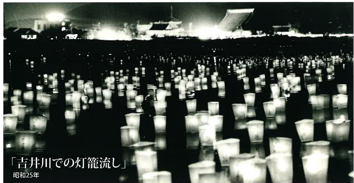
「吉井川での灯籠流し」