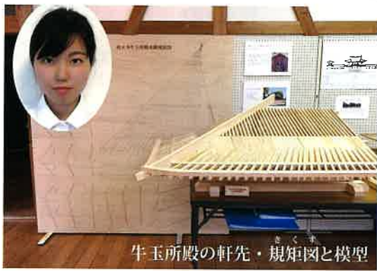
牛玉所殿の軒・規矩図と模型

牛玉所殿が縁で、宮大工という大きな夢を持った若い女性に出会いました。コロナ禍ですが、日本の、そして寺院にとっても、明るい未来が見えてくるような気がします。次のような投稿を頂きました。