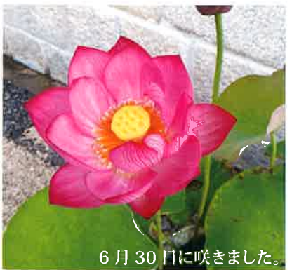
6月30日に咲きました。

その花の優美さに魅せられました。お仏壇にお供えした時の香り、優雅な実感忘れられません。蓮は植え替えの時、多くの