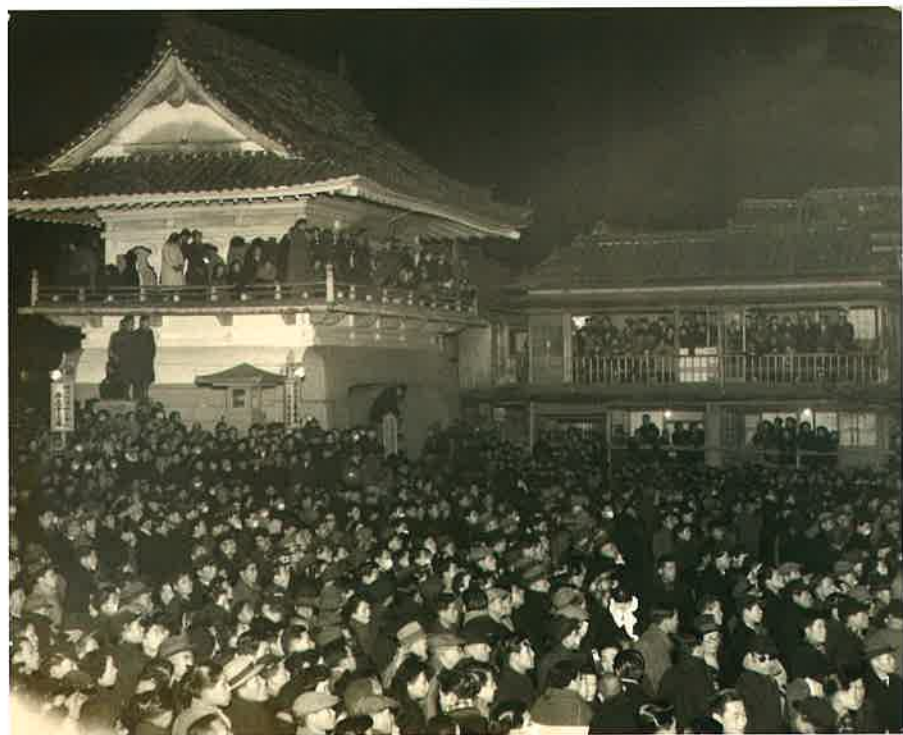
「会陽観客の波」 昭和27年2月10日午前1時 西大寺会場 石門・井筒屋旅館前

8月21日(土) 水まつり 供養のみ 塔婆・灯ろう流しあり (境内にて) 露店なし