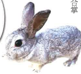
寶琳寺飼育 子口ちゃん