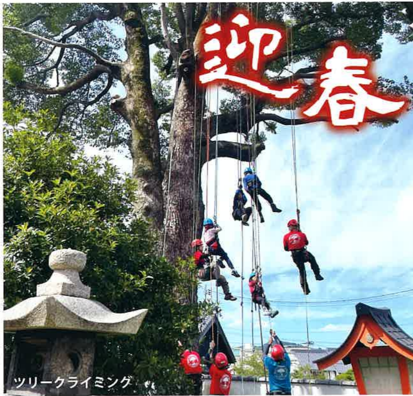
ツリークライミング