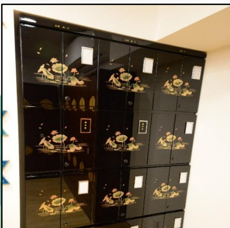
家族型※仏壇付 (Fタイプ) 80万円 (33年契約)～