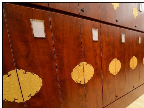
家族型 (Eタイプ) 90万円 (33年契約)～