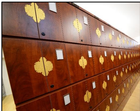
個室型 (Eタイプ) 40万円 (33年契約)～