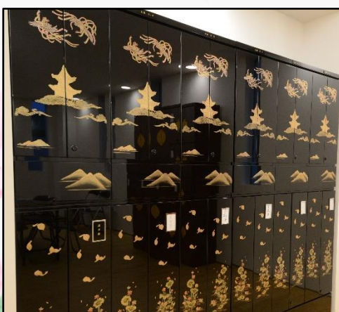
家族型※仏壇付 (Fタイプ) 222万円 (33年契約)～

※各納骨壇の金額とは別に 日拝供養(毎日供養)をさせて頂くに 当たり、一霊につき30万円の永代供 養料がかかります。